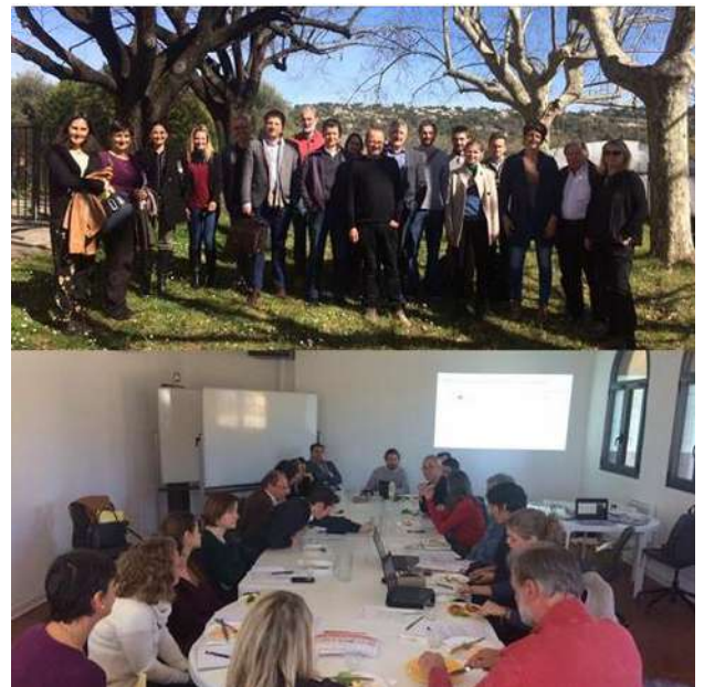
A la MEAD, 2e séance de travail avec les entreprises sur la place de l'alimentation durable dans leur quotidien

Soucieux du bien-être des salariés et de la promotion d'une économie plus solidaire, le Club participe à l'amorçage du projet de conciergerie solidaire inter-entreprises porté par la CCI NCA, en partenariat avec la CAPG, l'association EBG et Prodarom.